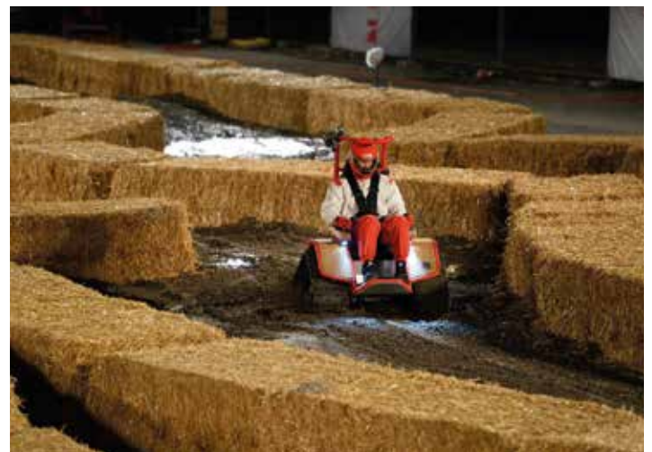
EVENTS / VERANSTALTUNGEN