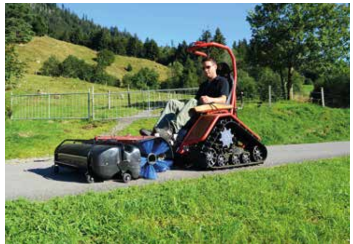
LAND- / FORSTWIRTSCHAFT