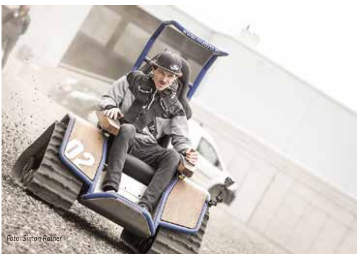
OUTDOOR / FUN SPORT